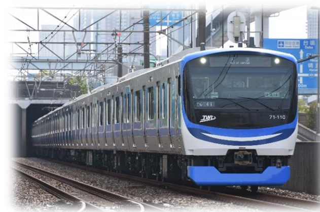
りんかい線新型車両 71-000形

鉄道等の公共交通は、一度に多くの旅客を運ぶことができるという点で、乗用車よりもCO2排出量が少ない「環境にやさしい」交通手段です。