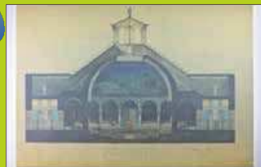
再認定試験のための大学講堂「バニンフォ」の図面 1878年/バルセロナ