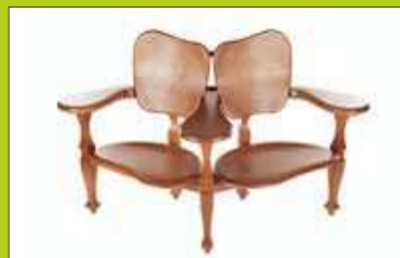
ダイニングルーム用ベンチ 1904-1906年/カサ・パトリオ、バルセロナ/ガビネット・モダ ニスタより貸与/レプリカ