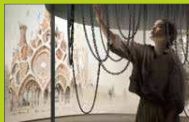
発見の工房ー フニクラ実験、見えない秩序を探してー