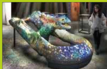
有機の海ーゲル公園に息づく光と波のリズムー

ガウディ没後100年、そしてサグラダ・ファミリアのメインタワー「イエスの塔」完成を迎える2026年。 自然から学び、美と秩序を形にした建築家アントニ・ガウディの思想と革新性を、アート・テクノロジー・デザインを融合するネイキッドの表現によって現代に再生。光と体験で紡ぐ新たな「ガウディとの出会い」がここに生まれます。