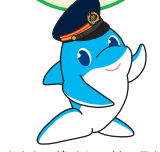
りんかい線イメージキャラクター りんかろう

りんかい線 公式LINEスタンプ LINEスタンプショップで検索してね! りんかろう