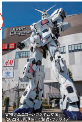
実物大ユニコーンガンダム立像 (2023年5月現在) © 創通・サンライズ

④0570-012780(受付時間10:00~18:00) ⑤東京都江東区青海1-1-10 ⑥りんかい線東京テレポート駅から徒歩約3分 ⑦詳しくはHPを確認 ⑧不定休 ⑨あり(有料)