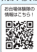
お台場体験隊の情報はこちら!

東京を代表する観光スポット・お台場には、地球と宇宙、未来を楽しく学ぶ日本科学未来館や、クリエイティブ力を育てるパナソニッククリエイティブミュージアム「AkeruE」など、子どもから大人まで、見て、ふれて、体験できるスポットが点在。そんなお台場を「学びの場」として利用できるよう、りんかい線ではモデルコースの提案や施設案内を行っている。りんかい線を上手に利用して、ファミリーやグループで知識の旅に出かけよう!