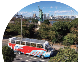
「お台場パノラマコース」もある