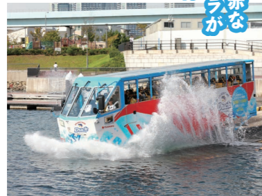
海に入るときはテンションUP