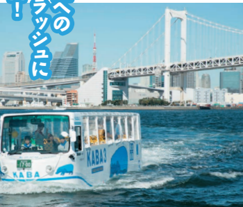
レインボーブリッジやお台場を海から一望