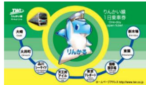
窓口発売・小児券