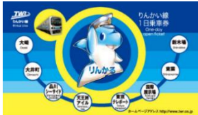
窓口発売・大人券

※JR線から大崎経由でご利用の場合、大崎駅までのきっぷをお求めのうえ、りんかい線各駅の改札窓口にお申し出ください。大崎駅からの乗車については有効とし、改札窓口で「りんかい線1日乗車券」を発売します。りんかい線内までの乗車券をすでにお求めになった場合については、各乗車券の代金から、りんかい線の運賃を差し引いた額により発売します。