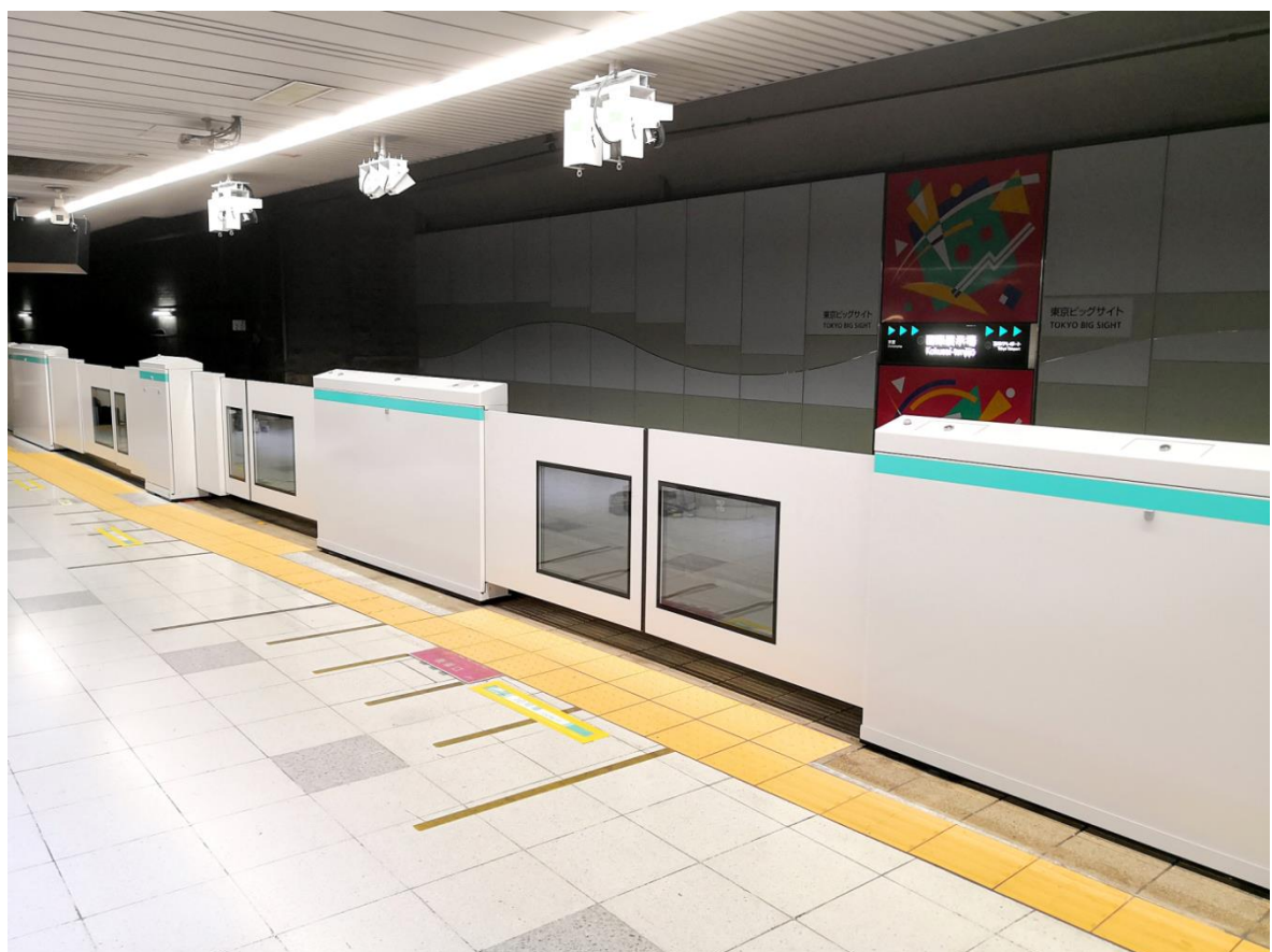
国際展示場駅ホームドア